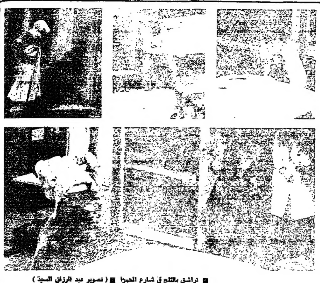
تراشق بالتلح في شارع الحورا